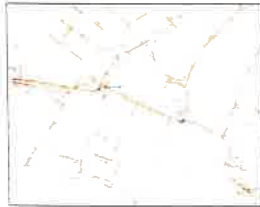
Schema Gaz Après Travaux