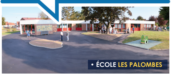
• ÉCOLE LES PALOMBES

Une cour toute neuve, prête à accueillir nos enfants.