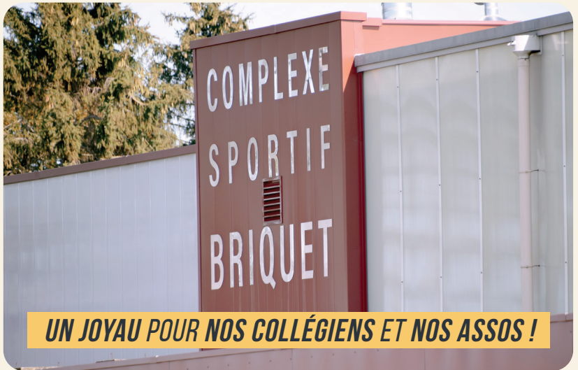
UN JOYAU POUR NOS COLLÉGIENS ET NOS ASSOS !

Le samedi 14 septembre a eu lieu la tant attendue inauguration du complexe sportif Michel Briquet.