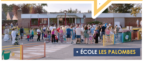
• ÉCOLE LES PALOMBES

C'est parti pour une nouvelle année , en avant les cartables !