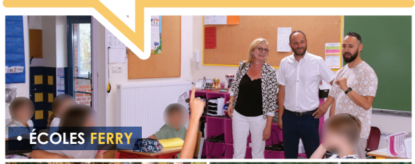
• ÉCOLES FERRY