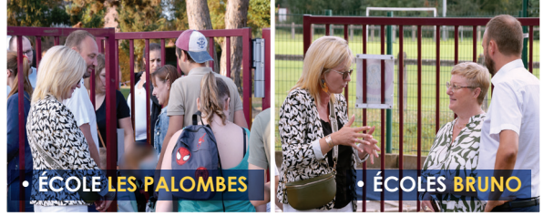
• ÉCOLE LES PALOMBES