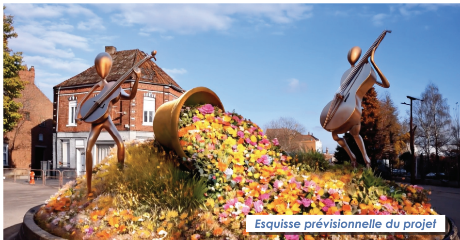
Esquisse prévisionnelle du projet

Ce sont des aménagements réalisés par les services techniques de la ville.