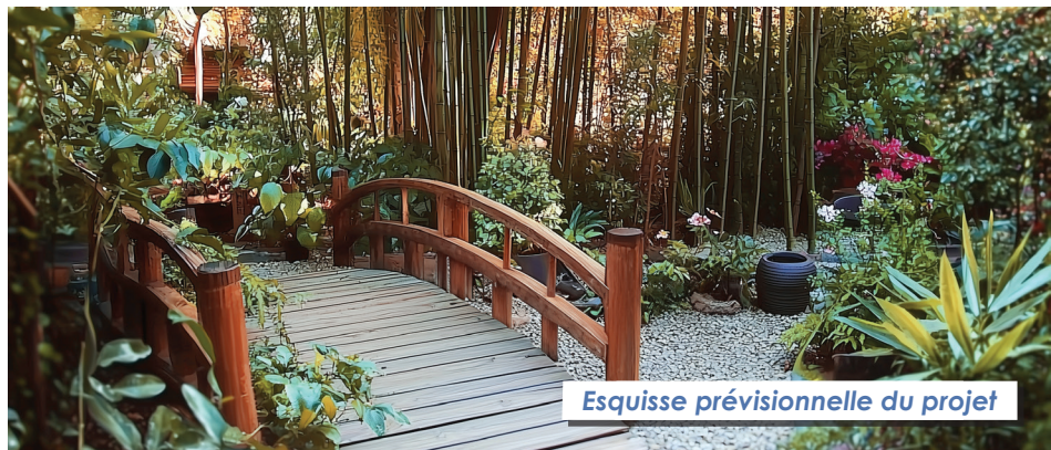
Esquisse prévisionnelle du projet